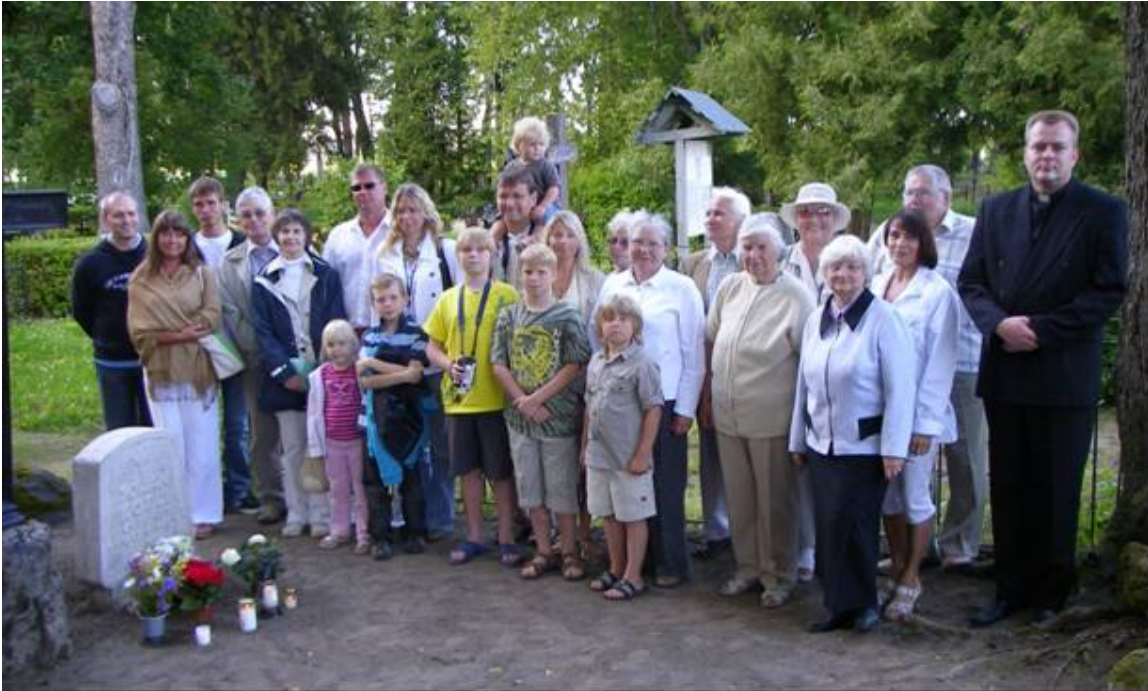
Mälestusküünla süütamine kalmistul. Pildil Johan Kotli järeltulijad peredega ja korraldajad.