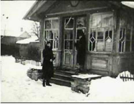
Köstrimaja (Simuna mnt. 5) ehitati tõenäoliselt 1880. aastate alguses varasema rehielamu asemele