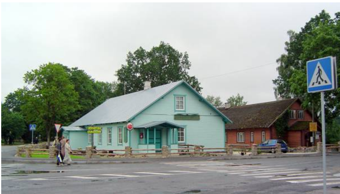
ja on nüüd Georgi söögituba.