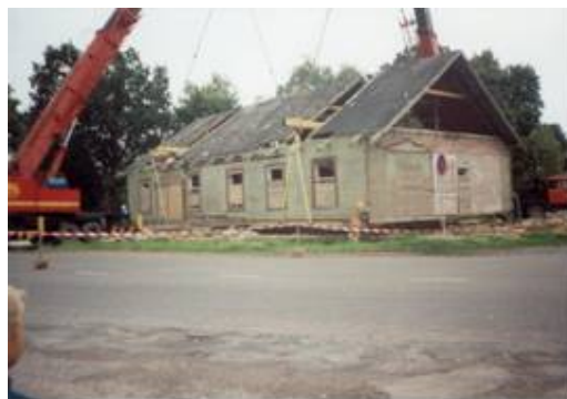
Vana kauplusehoone tõsteti teest eemale uuele vundamendile 2001.aastal. 6