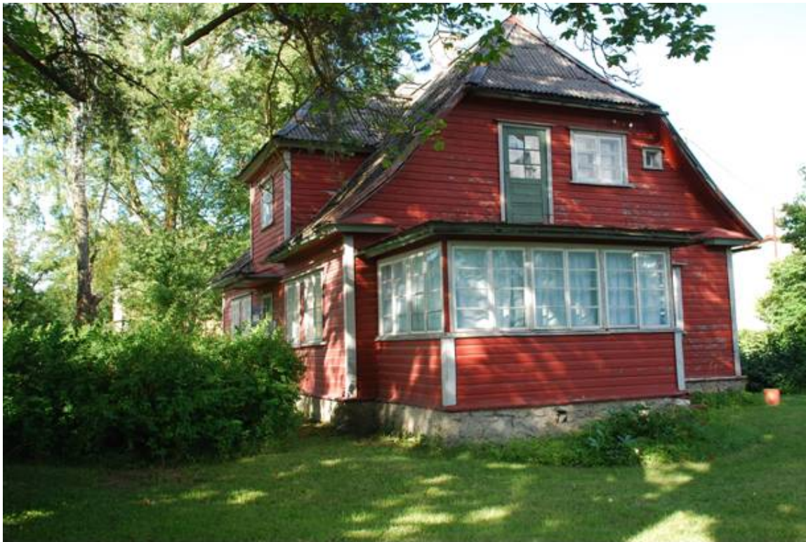
Ja sama elamu 2008.a. 29.juulil